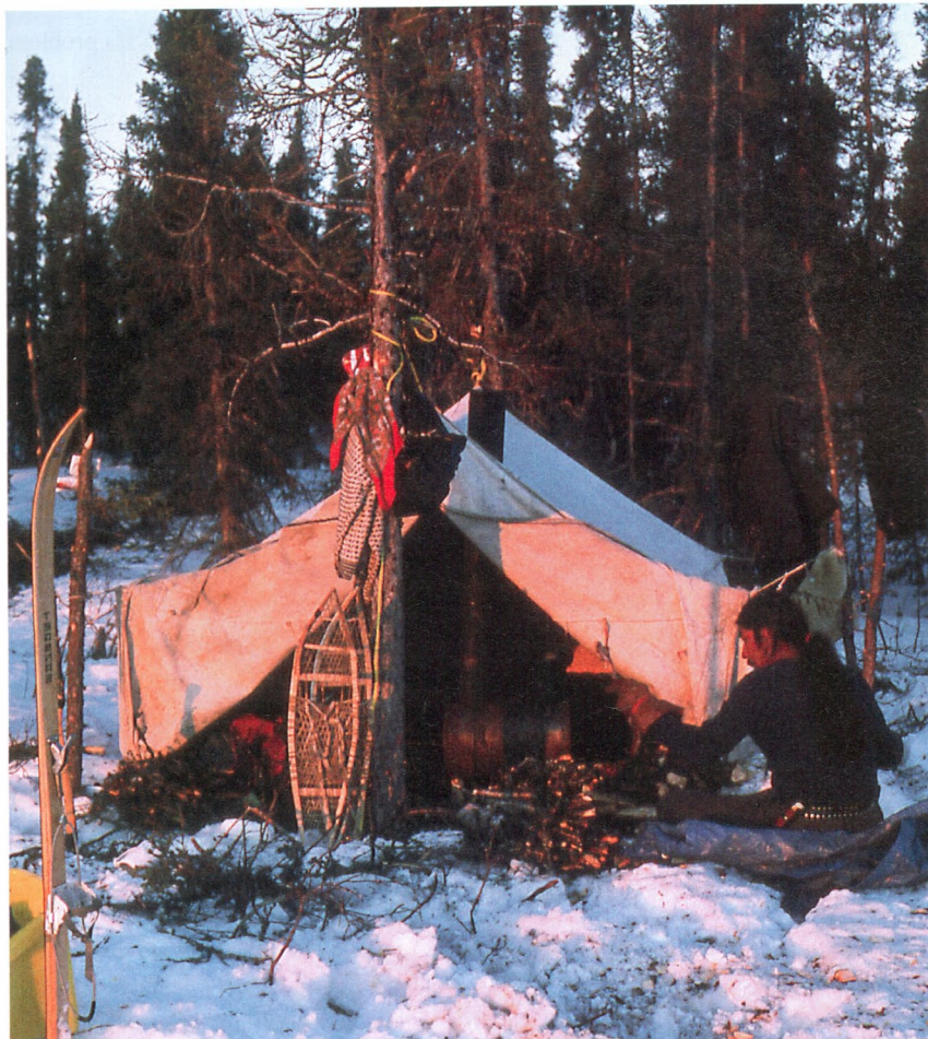
Med skidor och snöskor tog man sig fram i den djupa snön i jakt på vildren.

nusgrader. Men stugan som isolerades med mossa stod emot kylan och de medhavda oljefatn användes som eldstad och ugn. Friskt vatten hämtades från sjön och markerna bjöd på rikliga jakt- och fiskefångster.