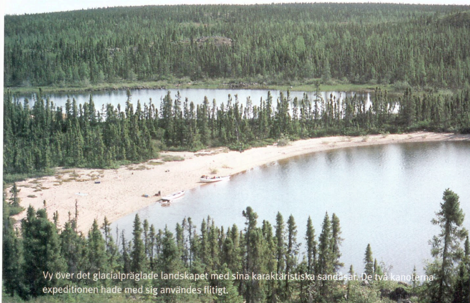
Vy över det glacialpräglade landskapet med sina karaktäristiska sandöar. De två kanoterna expeditionen hade med sig användes flitigt.